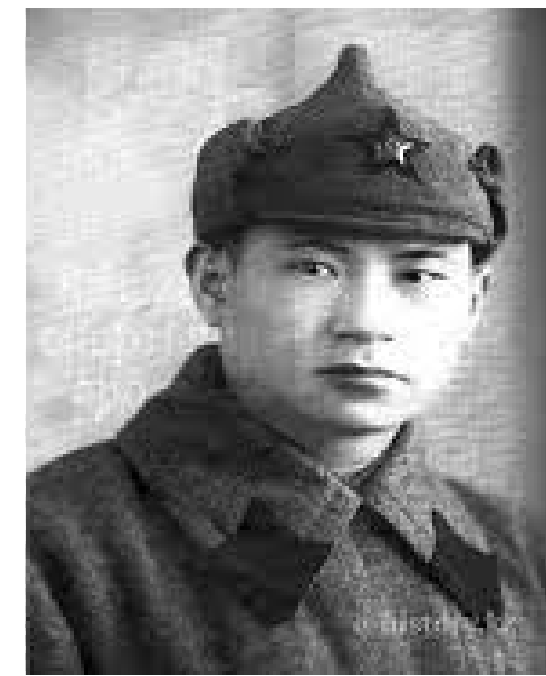
Жұбайы: атақты қазақ боксының атасы-Шоқыр Бөлтеқұлы